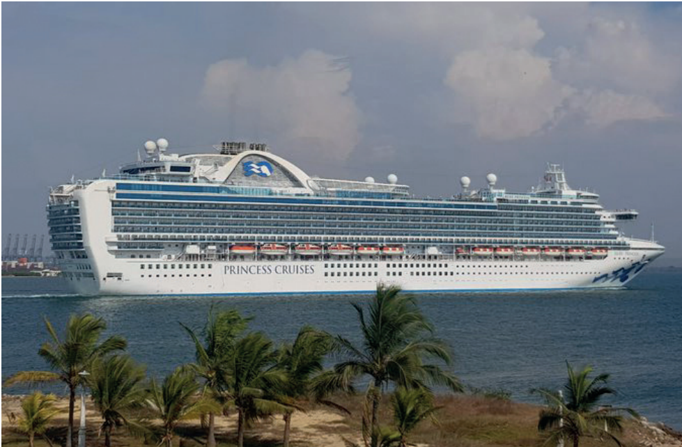
Foto 6. Maravillosa vista desde uno de los lugares más icónicos en Castillo Grande, el Fuerte de San Juan de Manzanillo. Gracias España por tanta ingeniería.

En esta edición, nos complace compartir algunos de los momentos más emblemáticos y significativos del mundo marítimo, una selección de cautivadoras fotografías que nos transportarán a escenarios maravillosos de nuestro país, imágenes captadas desde el lente personajes ANPRA, quienes acompañan su registro con frases significativas.