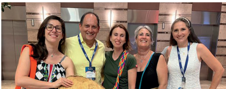
Foto 9. Las esposas y familias de los Pilotos Prácticos son fundamentales en esa profesión. Gracias por acompañarnos y por apoyar la tarea.

Nos complace sumergir a nuestros lectores en un viaje visual a través de una cuidadosa selección de cautivadoras fotografías que capturan los momentos más emblemáticos y significativos del Segundo Congreso de Lecciones Aprendidas ANPRA. Estas imágenes nos invitan a revivir los instantes llenos de inspiración, conocimiento y camaradería que marcaron este destacado evento. Únete a nosotros en este recorrido que nos transportará nuevamente a través de la experiencia inolvidable del congreso, recordando la importancia de compartir y difundir el aprendizaje en el ámbito marítimo y fluvial.