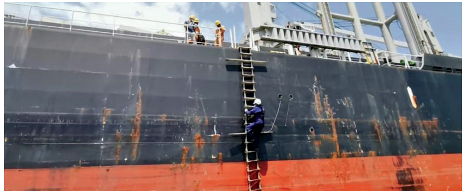
Foto 3. El Capitán Flórez, al igual hombre de mar, ejerciendo una de las acciones más arriesgadas de su trabajo.

O.M.F.R.: Que se preparen, lo pilotos necesitan un relevo generacional, nadie es eterno y que es una actividad apasionante y es una actividad bien interesante, es una actividad que le permite a uno realizarse como persona, como profesional, y los que sigan la carrera del mar, pues encuentran allí una buena actividad que es muy gratificante, es muy enriquecedora y es muy apasionante.