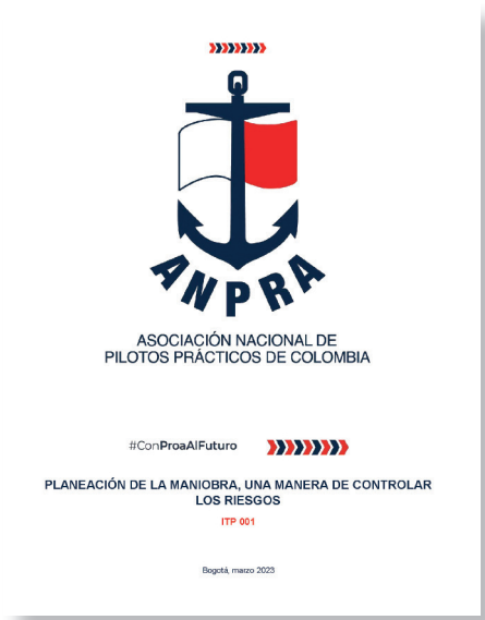
Foto 4. Portada de la primera ITP publicada en la página web de ANPRA, en el mes de enero 2023.

El proceso inició con la generación de una estructura capitular que actualmente tiene 5 de ellos, que son: 1. Actividades del practicaje, 2. Aplicabilidad del marco jurídico nacional e internacional, 3. Seguridad en la actividad del practicaje, 4. Tipos de entrenamiento de pilotos prácticos, 5. Información náutica y meteomarina del área de maniobra.