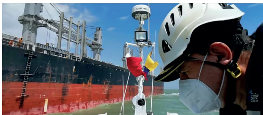
Foto 2. Máximo nivel de concentración y profesionalismo

Capitán, ¿por qué es importante un piloto práctico en el desarrollo marítimo del país?