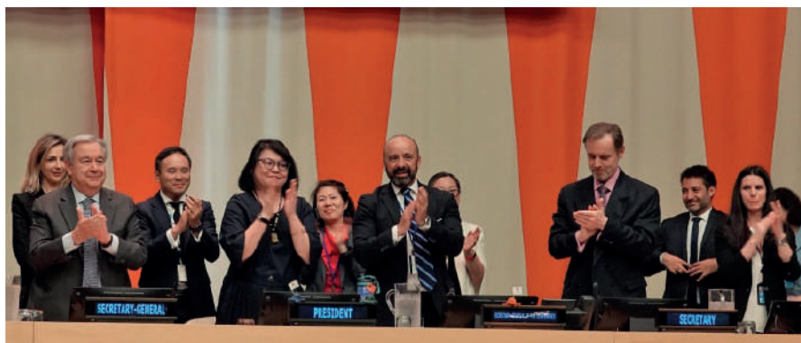
Foto 10. Nuevo acuerdo histórico fortalecerá la protección de la biodiversidad marina en alta mar.

El tratado BBNJ aborda, entre otras cosas: