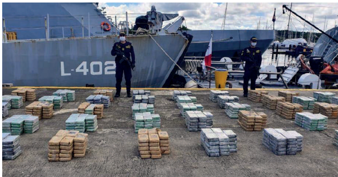
Foto 6.

Finalmente, la técnica cubierta es quizás la más utilizada y consiste en ubicar los estupefacientes sobre la superficie, tanto de espacios cerrados como abiertos, de modo que no existe ninguna intención de encubrir la actividad delictiva.