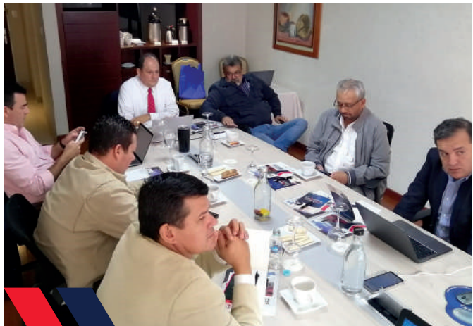
Foto 5. Reunión Junta Directiva ANPRA. Bogotá 06 de junio 2023.