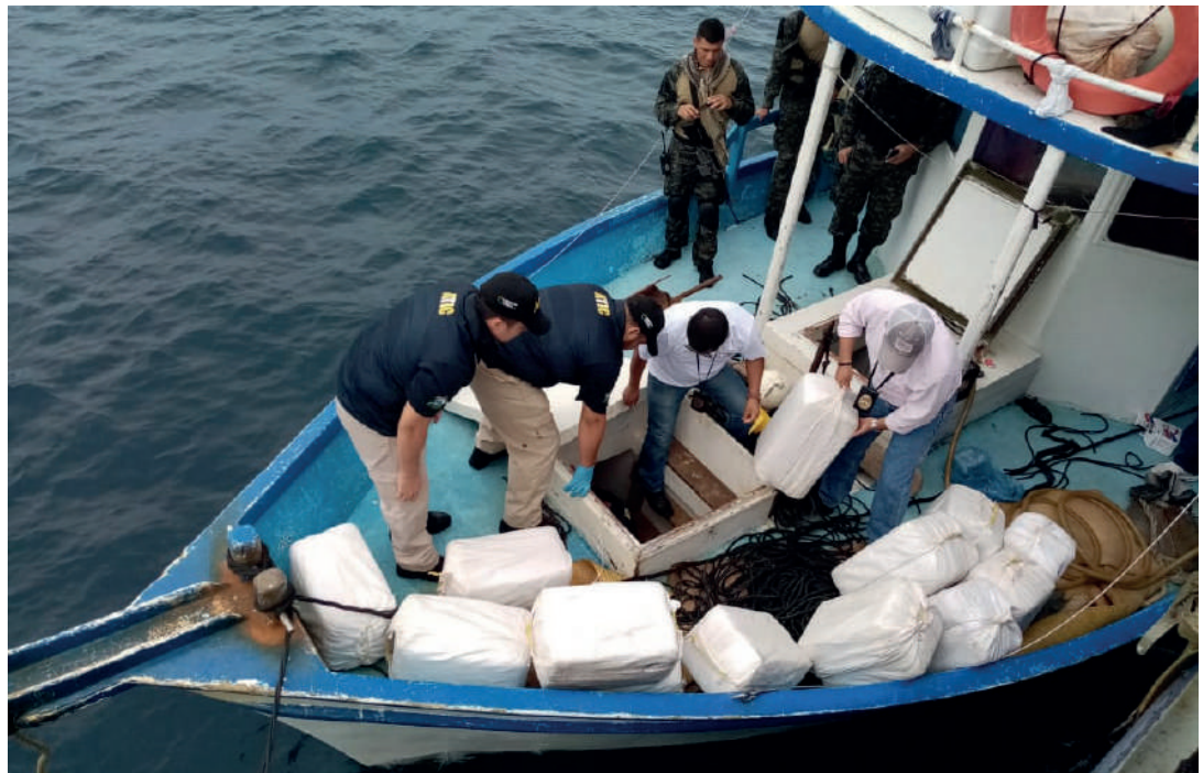
Foto 7.

Es indispensable la cooperación entre todos los actores del escenario marítimo (autoridades, pilotos prácticos etc.) para reconocer el uso de alguna de las técnicas del narcotráfico marítimo a tiempo para frenar el desarrollo de esta actividad ilegal que afecta la seguridad e intereses de los pilotos prácticos, de Colombia y de varios Estados en el mundo.